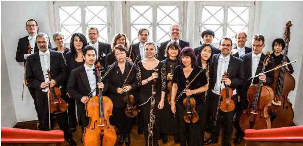
Am 4.12. zu Gast in der Bettrumer Kirche: Das KonzerthausOrchester Wernigerode.