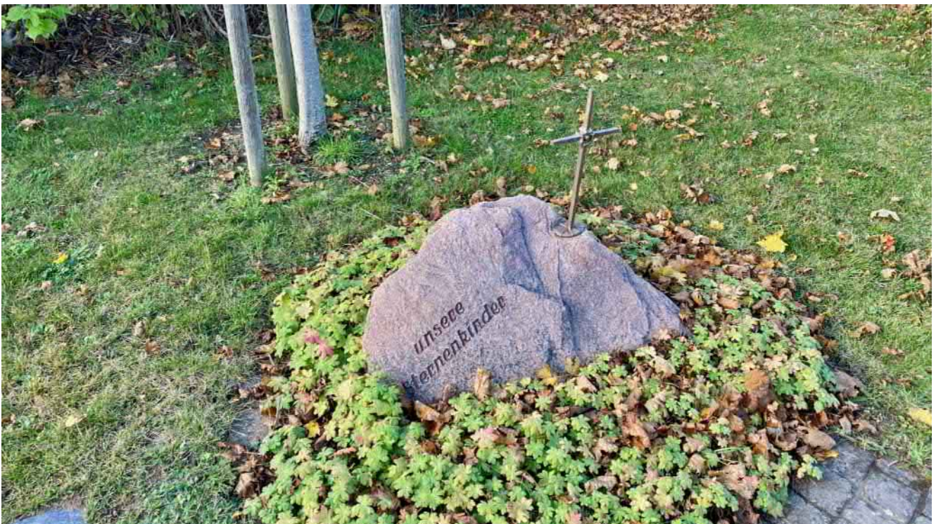
Das Sternenkinder-Grabmal auf dem Söhlder Friedhof. Foto: Brühl.