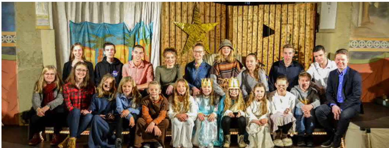
So oder so ähnlich könnte es am Ende dieses Jahr wieder aussehen: Bild vom Krippenspiel 2019 in Nettlingen.

Waisen sind Kinder, die ihre Eltern verloren haben. So weit so klar. Unsere drei Waisen fangen allerdings einen ganz besonderen Brief ab und spielen ab diesem Moment eine wichtige Rolle in der diesjährigen Weihnachtsgeschichte in Nettlingen: Sie folgen dem Aufruf, sich nach Bethlehem zu begeben und begegnen auf ihrer Reise den Personen, die wir mittlerweile schon gut kennen. Engel, Hirten, Wirte, Maria und Josef sowie ein Gesandter des Kaisers sind mit von der Partie und ein (lebensgroßer) Stern steuert die notwendigen Hintergrundinformationen für ein besseres Verständnis der Geschichte bei.